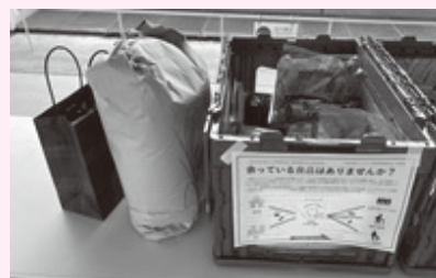
▲岐南タウンミーティング フードドライブの様子