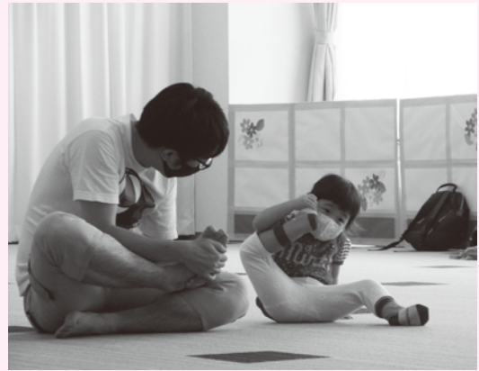
にここサロン 「育児講座」の様子▶