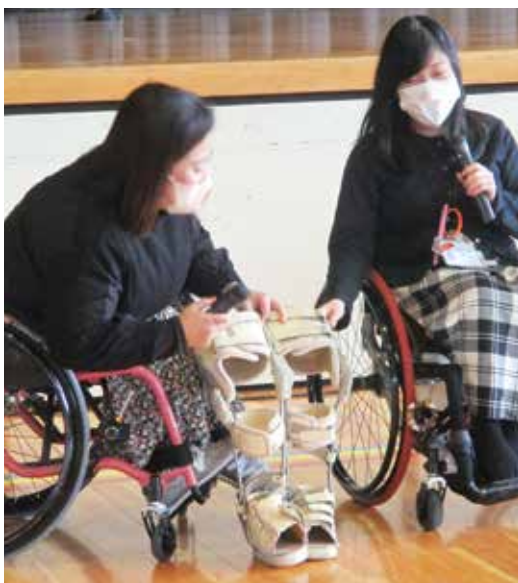
▲会費を活用した事業のようす (福祉教育支援事業:車いす講話)