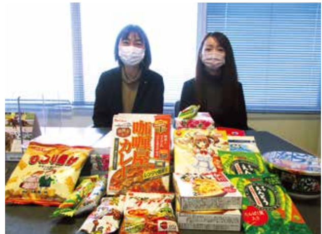
▲明治安田生命岐南営業所の皆様から、食糧をご寄附いただきました