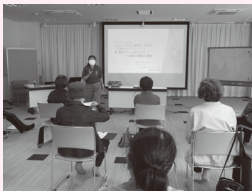
▲家族介護教室の様子