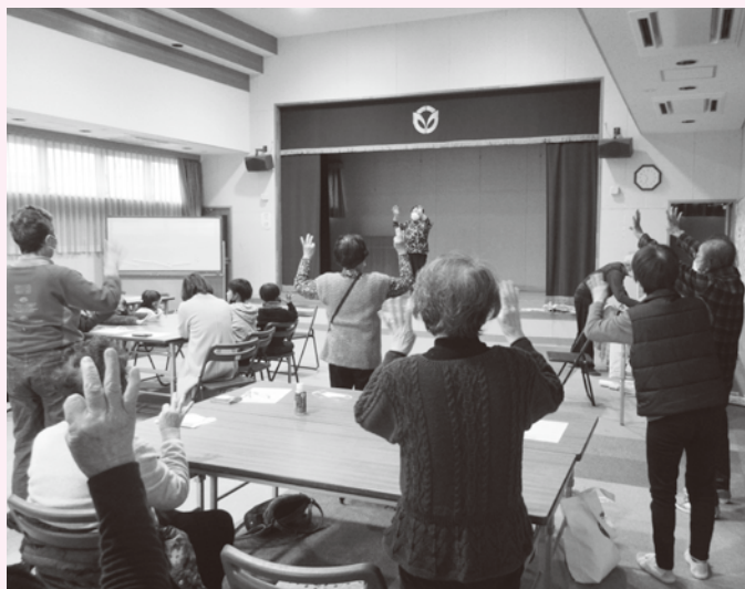
▲ぎなんチームオレンジ交流会「もちの木」の様子