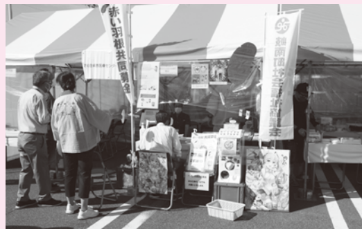
▲街頭募金のようす