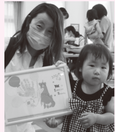
多世代交流カフェ 「なんカフェ講座」 手形足形アートの様子▶