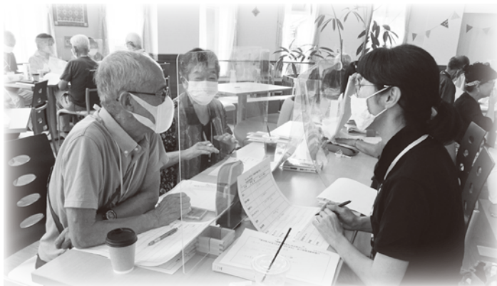
▲地域ごとにワークをします