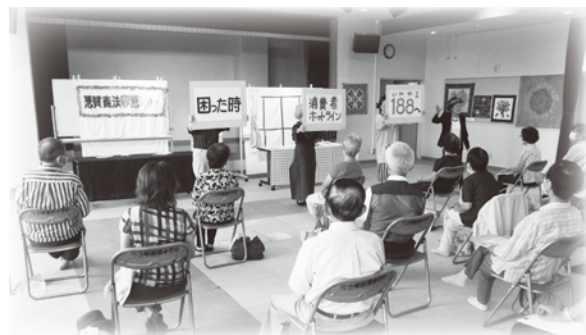
▲特殊詐欺防止について学びました(ローズサロン)