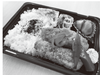
◀なんカフェ弁当をお届けします