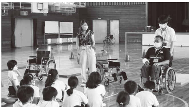
◀車いす体験のようす

高齢者や障がい者等への理解を深めたり、未来の福祉の担い手を育成するため、保育園や小中学校への出前講座やボランティア活動、地域交流活動に対する補助金を交付し、連携しながら活動しています。