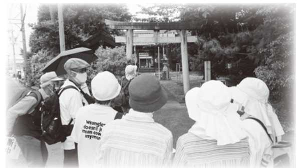
▲ウォーキングをしながら交流しました(オレンジ東)