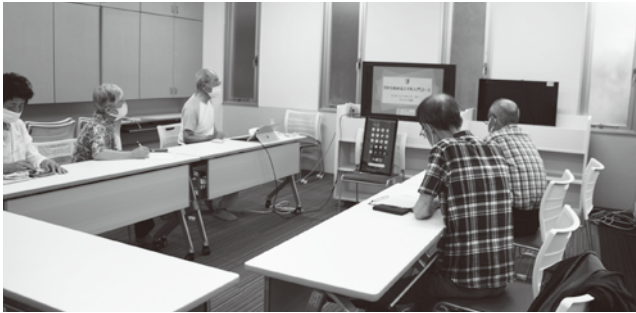
▲互いに教え合いながら学びます(スマホカフェ)

地域で行われる、いきいきサロンや見守り活動、助け合い活動などを支援するための助成金を交付し、高齢者を始めとする地域の皆さんが気軽に参加、交流できる居場所やつながりの場を提供する活動を進めています。