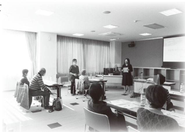
▲高齢者等への接し方を学びます(昨年度の講座のようす)