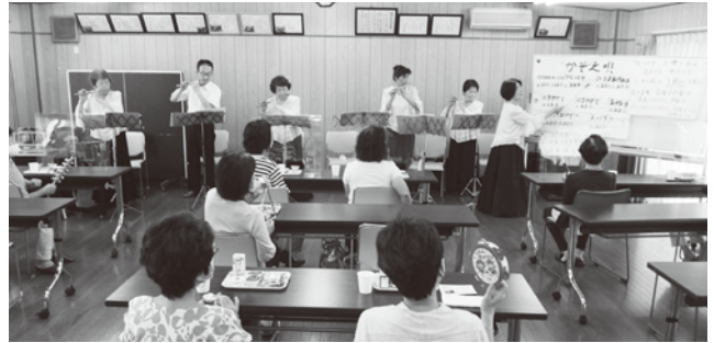
▲音楽を聴きながら楽しく交流しました(須賀っとサロン)