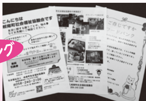
▲ ポスティングちらし