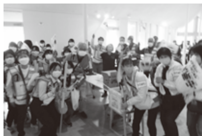
ウォークラリーイベント

地域のつながりを深めるために、昨年度作成した『お散歩マップ』を活用してウォークラリーイベントを開催し多世代が交流しました。イベントの実践から新たな課題解決に向けて検討をしていきます。