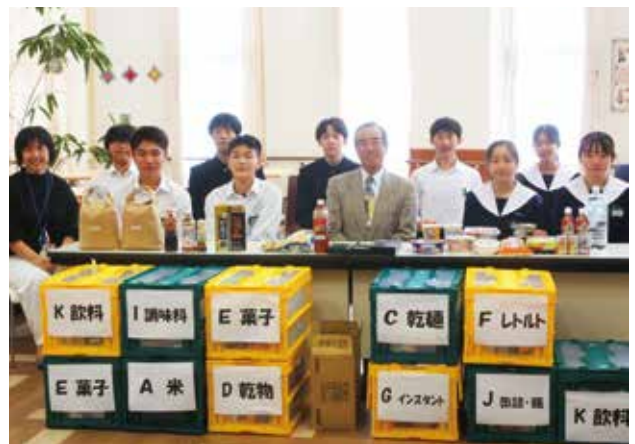
▲ 岐南中学校3年生有志の皆さん