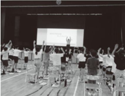
小学校5年生の講座