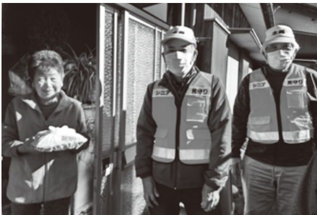
▲ 本郷カフェの皆さん

地域の方に気軽に相談していただけるように、町内を2分割して社会福祉協議会や地域の福祉サービスの情報を、職員がポスティングしてお届けしました。(今年度は西地区)