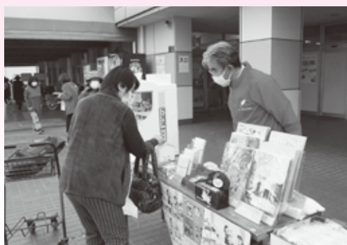
▲ 街頭募金のようす(おんさい広場はぐり)

地域のボランティア会員さんが、お菓子などの手土産を添えて、高齢者宅などを訪問しました。