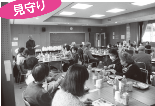
▲ 見守り食事会のようす(野中北南高齢者見守会)