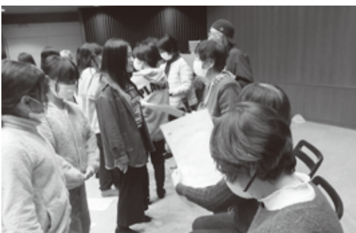
東小6年生との交流