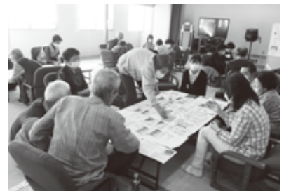
若宮地サロンでカードゲーム