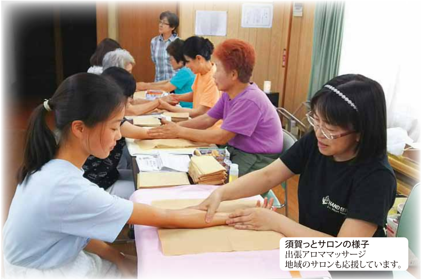
須賀っとサロンの様子 出張アロママッサージ 地域のサロンも応援しています。