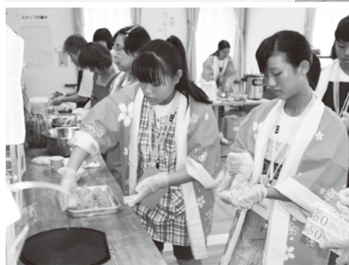
▲岐南中学校ボランティア活動