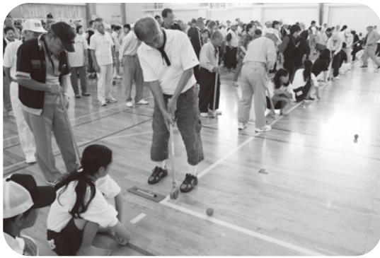
▲目指せホールインワン!