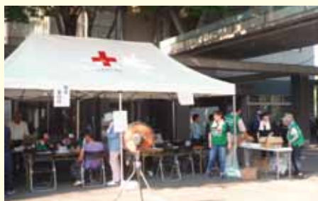
▲関市災害ボランティアセンターの様子

平成30年7月豪雨災害により岐阜県関市は甚大な被害に見舞われました。7月9日から20日まで関市社会福祉協議会により設置された関市災害ボランティアセンターに7月14日、15日、16日の3日間、岐南町社会福祉協議会からも職員5名を派遣し、災害ボランティアセンター運営のお手伝いをさせていただきました。