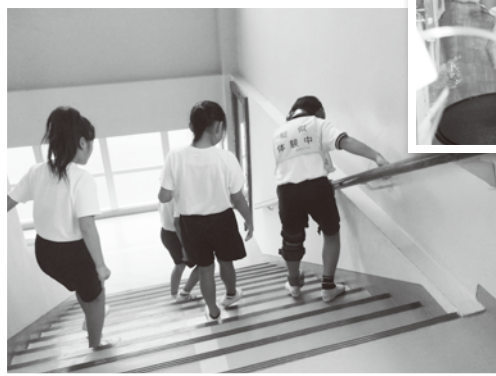
▲東小学校での高齢者疑似体験