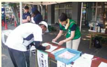
▲ボランティア保険の受付業務

災害ボランティアセンターでは、全国各所から駆け付けたボランティアの方の受付、保険加入、ボランティア派遣先のマッチング、活動後の活動報告の確認までを行いました。