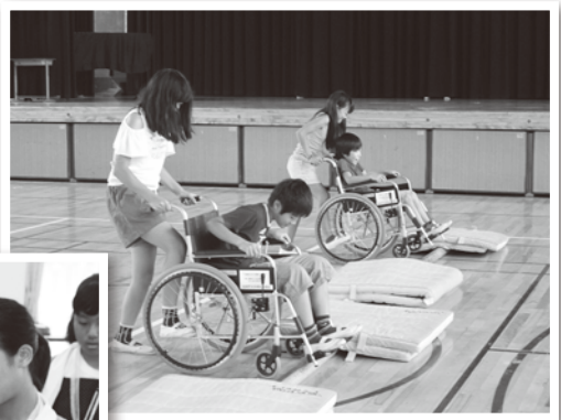
▲北小学校での車椅子体験

岐南中学校では、生徒によるボランティア活動に力を入れており、町内外の様々なイベントやボランティア活動に積極的に参加し、地域との関わりを大切にしています。