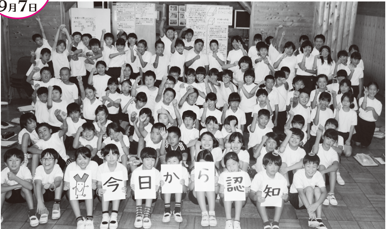
▲岐南町立東小学校5年生の認知症サポーター107名

認知症になっても地域の中で安心して自分らしく暮らすことができるようにするためには、まわりの方々の理解が大切です。6月の岐南町立西小学校に続いて、東小学校・北小学校5年生の児童を対象に認知症サポーター養成講座を開催しました。認知症の事を正しく理解し、どのように接したら良いかの劇を観たり、それぞれの役を演じたりして学びました。