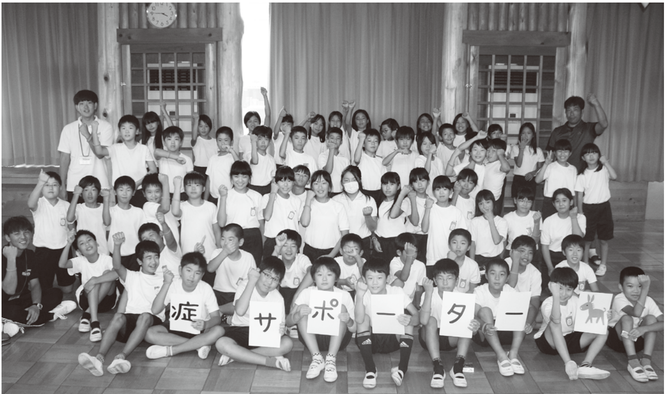
▲岐南町立北小学校5年生の認知症サポーター69名