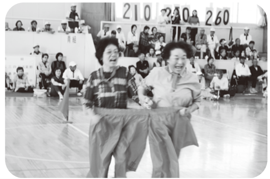
▲息ピッタリのデカパン競争