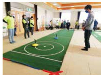
▲ユニカールのようす