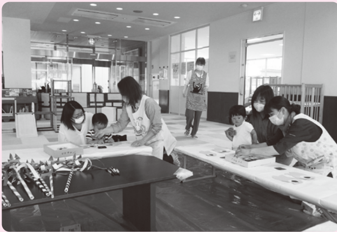
▲ にこにこサロンでのようす

地域の子育ての先輩として、「地域の身近な相談役」、「地域の子育て家族同士の橋渡し役」を担うという立場で、子育て中の母親等の良き話し相手、相談相手となったり、子どもたちの遊び相手となったりして、子育て支援活動に理解と熱意を持って参加しています。