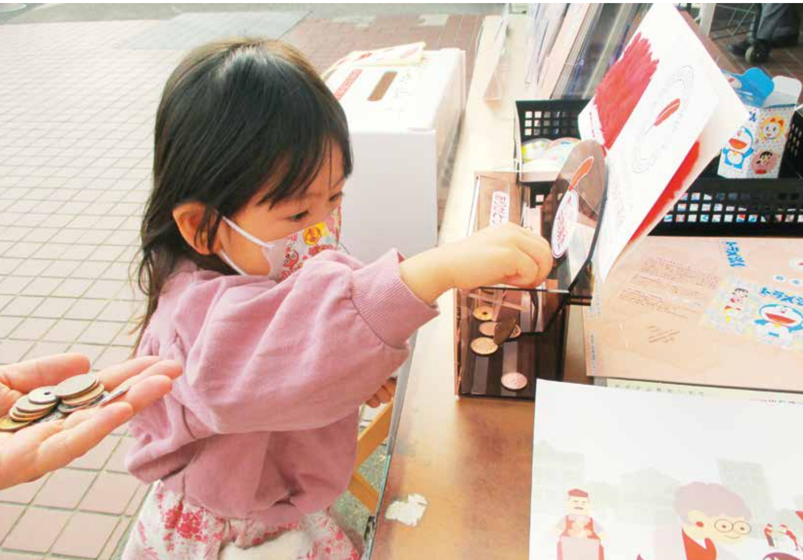
▲昨年度の街頭募金のようす（JAおんさい広場はぐり店）