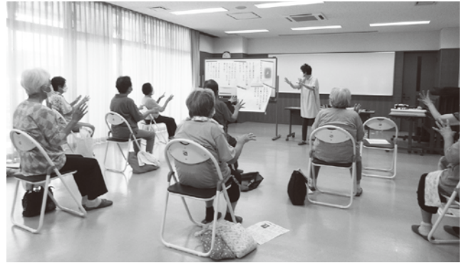
▲音楽に合わせて体操(サロンすずらん)