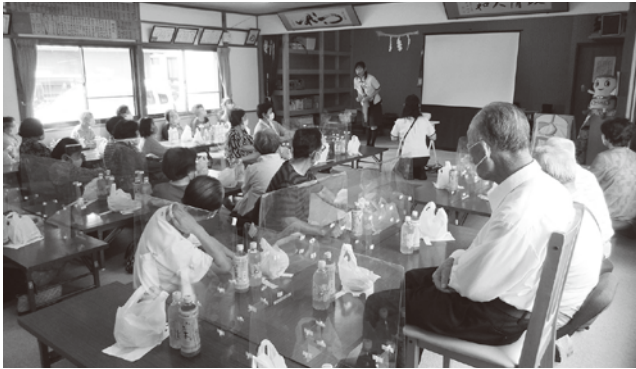
▲ヤクルトさんによる講話(東組サロン)

地域で行われる、いきいきサロンや見守り活動、助け合い活動などを支援するための助成金を交付し、高齢者を始めとする地域の皆さんが気軽に参加、交流できる居場所やつながりの場を提供する活動を進めています。