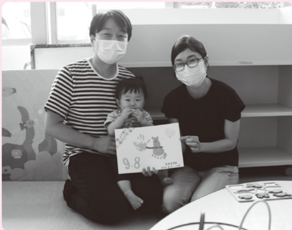
▲ すくすくサロンでのようす