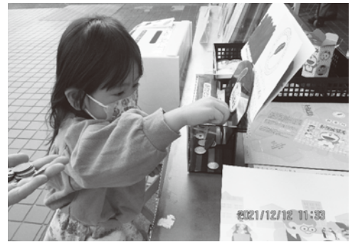
▲ 街頭募金(おんさい広場はぐり店)