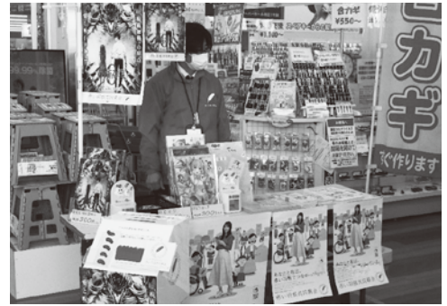
▲ 街頭募金(DCMカーマ21岐南店)