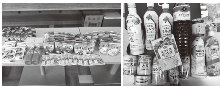
▲ ご寄附いただいた食品