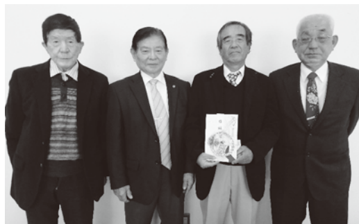
▲ 岐南町老人クラブ連合会の皆様

岐南さくら保育園 岐南さくら南認定こども園 岐南さくら北保育園 岐南さくら認定こども園 けやきの社 うれしの認定こども園 うれしの東保育園 岐南町役場職員 岐南町社会福祉協議会役職員